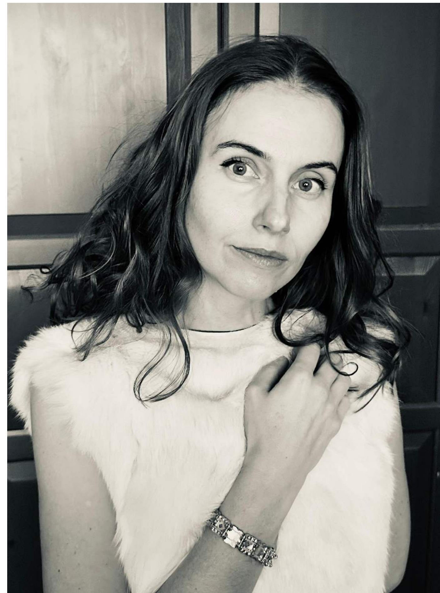
Dramatička v štýle svojej hrdinky